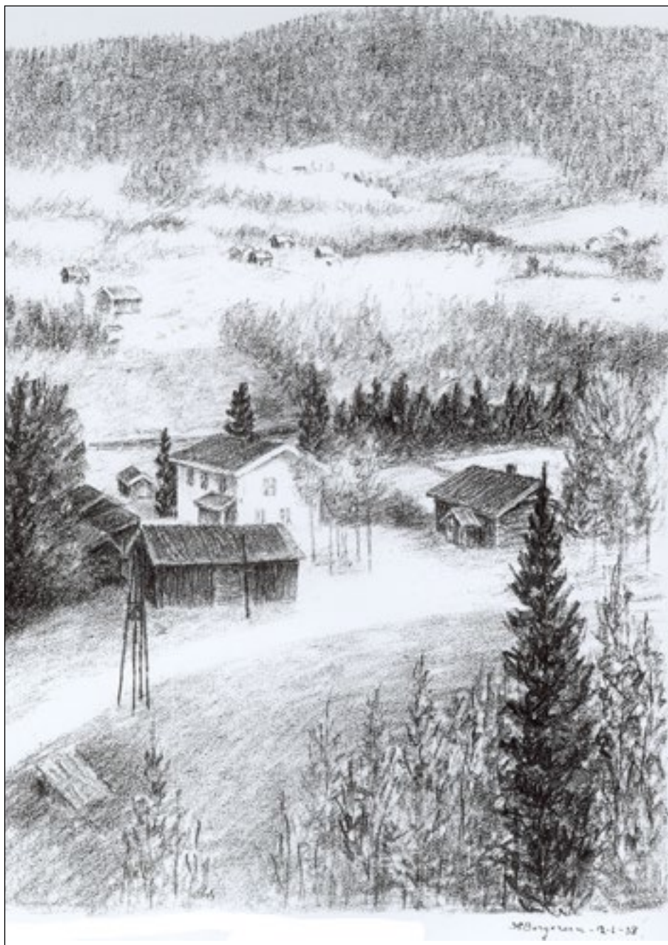
Brennhaugen i Knapper, tegnet av Hans Christian Bergersen i 1938.