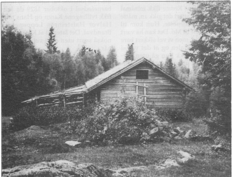
Pasotorpet i 30-årene.